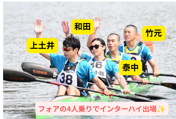
フォアの4人乗りでインターハイ出場☆