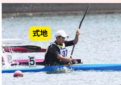
カヤックシングルでインターハイ出場☆